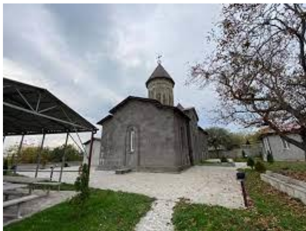
ნახ. 7. წინწყაროს წმინდა ნიკოლოზი სახელობის ეკლესია