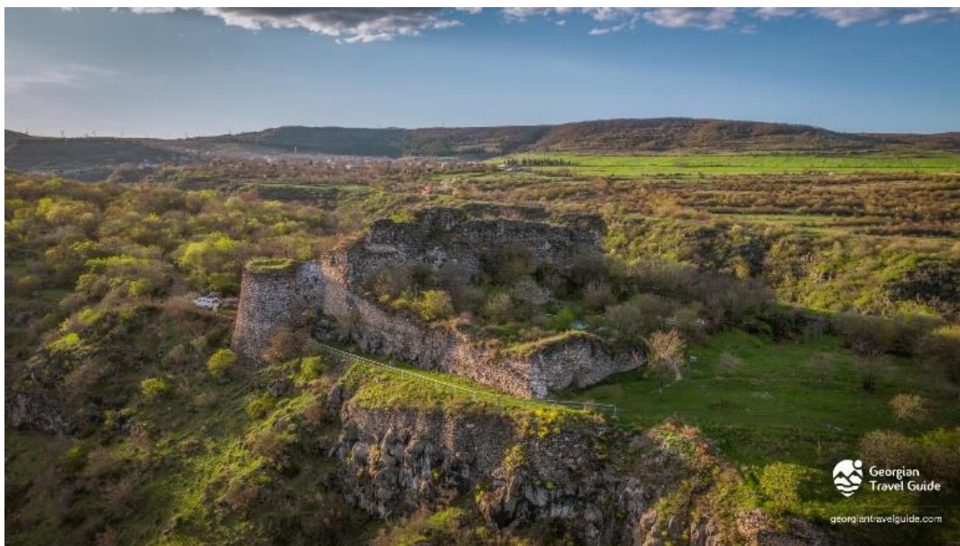
ნახ. 4. სამშვილდის კომპლექსი