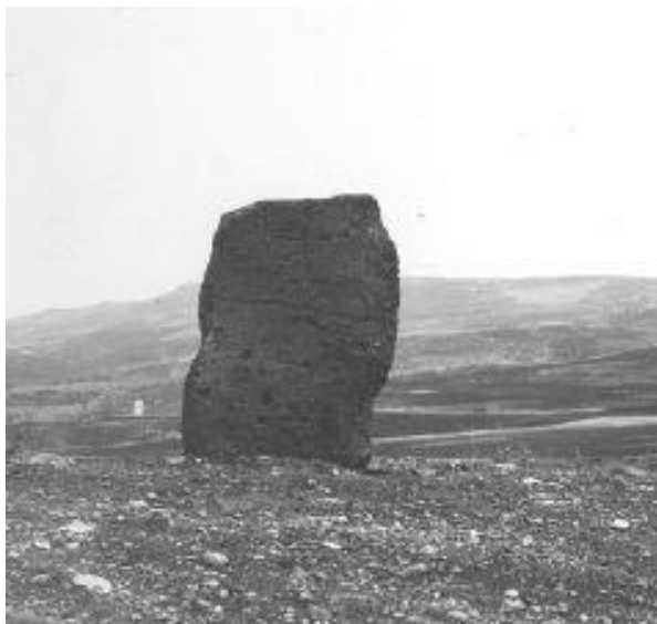
ნახ. 6. შავსაყდრის ეკლესიის ნაშთი