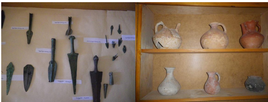
ნახ.8. თეთრიწყაროს მუზეუმში დაცული არქეოლოგიური ექსპონატები